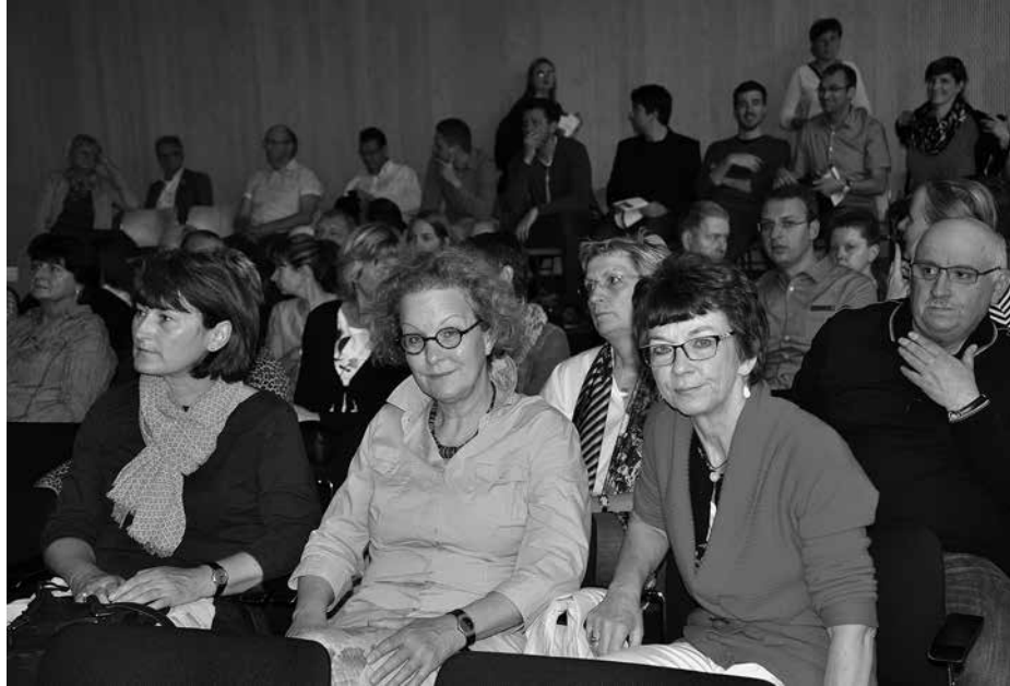
Aufmerksame Zuhörer verfolgten die Vorträge