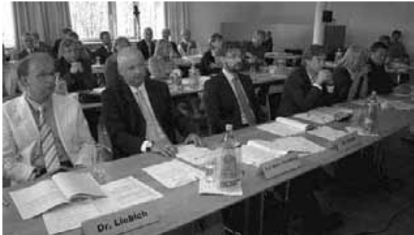
Nachdenkliche Gesichter in der Versammlung. Es standen knifflige Fragen auf der Tagesordnung.

Wenn Abeln davon spricht, dass sich in absehbarer Zeit entscheiden wird, wie es mit der gesetzlichen Krankenversicherung zukünftig weitergehen wird, sieht er nicht ausschließlich die zahnärztliche Selbstverwaltung in der Pflicht, politische Vorgaben umzusetzen. „Wir haben auch Rechte und diese müssen wir innerhalb eingeräumter Spielräume nutzen, um gemeinsame Ziele zu erreichen“, führte er an. Dafür ist es wichtig, eine geeinte Zahnärzteschaft zu haben. „Das haben wir jetzt. Wodurch? Durch die Zwangsmitgliedschaft in der Körperschaft“, sagte Abeln. Hier wird es Veränderungen geben. Der Wettbewerb unter den Zahnärzten nimmt zu, aber auch der Wettbewerb zwischen gesetzlicher und privater Krankenversicherung. Krankenkassen verändern den Aufgabenumfang ihrer Landesvertretungen, bieten Selektivverträge an und können damit den Sicherstellungsauftrag in diesem