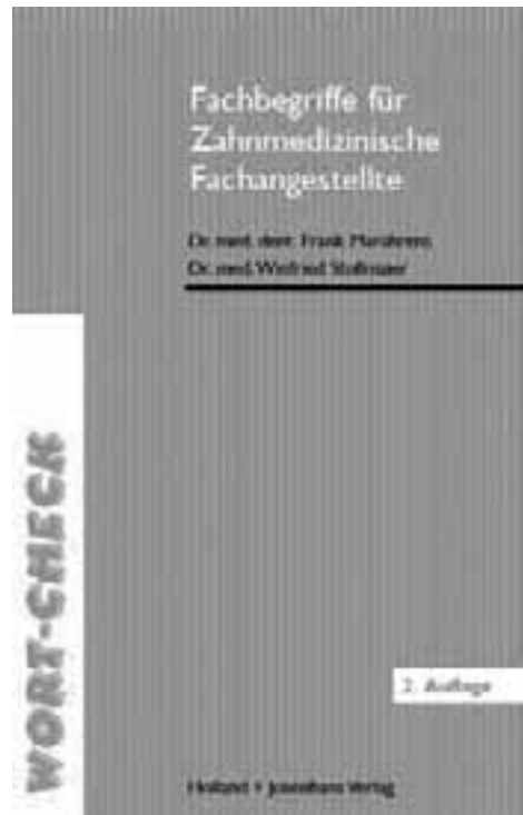
Verlag Holland&Josenhans, 2. aktualisierte Auflage 2008, Taschenbuch, 88 Seiten ISBN 978-3-7782-5864-4, 8,20 Euro