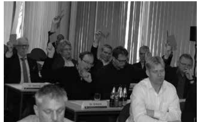
Während einer Abstimmung

Kammermitglieder können das Protokoll der Kammerversammlung nach Genehmigung auf der Homepage der Zahnärztekammer ( www.zaekmv.de unter Kammer/Kammermitglieder intern) einsehen. ZÄK