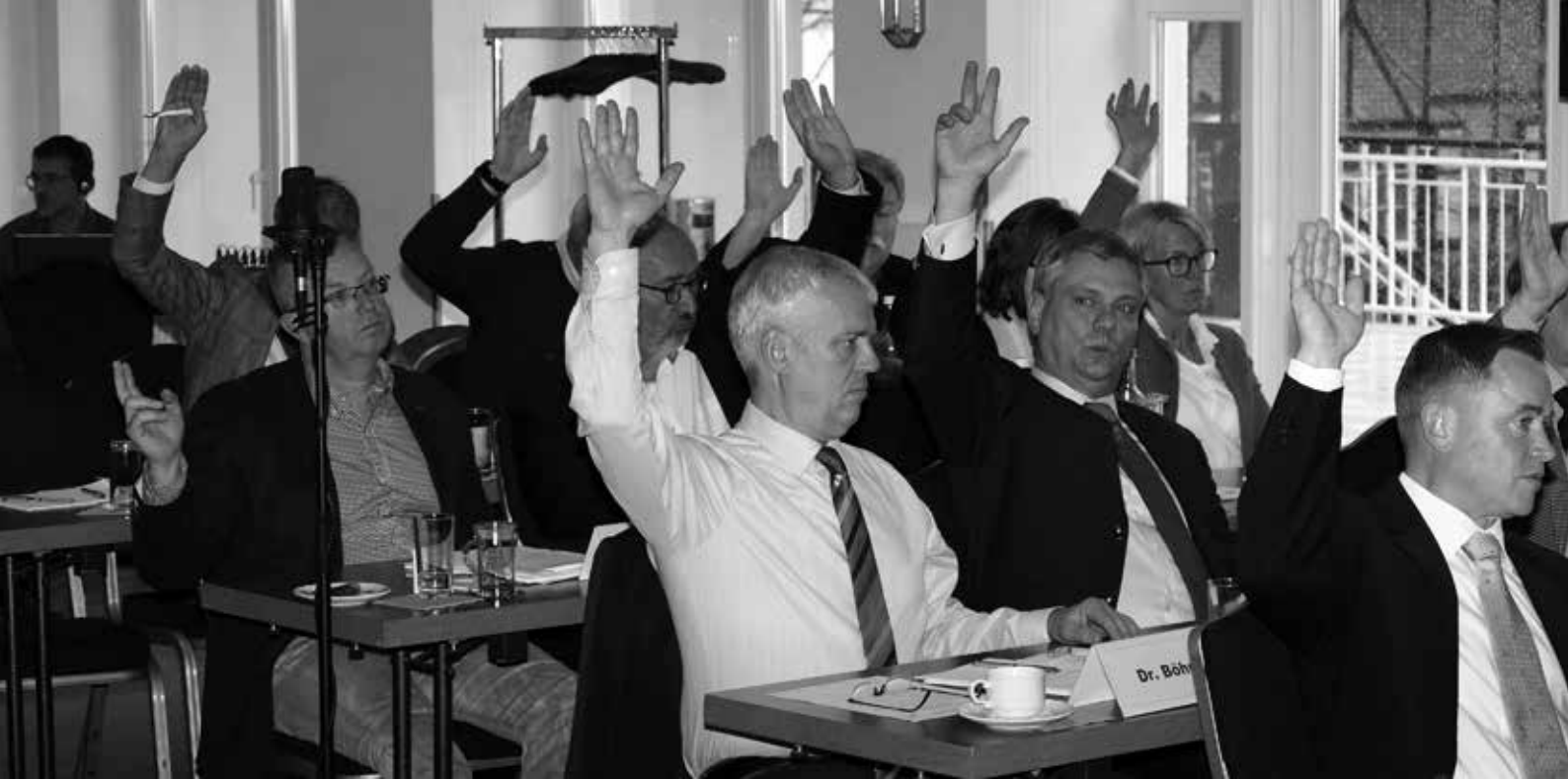
Die Mitglieder der Vertreterversammlung bei der Abstimmung