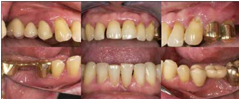
Abb. 1: Schwere chronische Parodontitis bei Typ 2 Diabetes