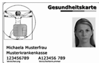
So soll sie aussehen: die elektronische Gesundheitskarte 2011

Die Finanzierungsvereinbarung zwischen den Landesverbänden der Krankenkassen und der KZV Mecklenburg-Vorpommern ist mittlerweile abgeschlossen. Mit Schreiben vom 29. März wurden die Zahnarztpraxen über ihre individuellen Ansprüche an Refinanzierungspauschalen informiert. Die Refinanzierung über die Pauschalen läuft bis zum 30. September. Bis zu diesem Datum haben die Zahnarztpraxen Zeit, die Kartenterminals zu installieren, die ent-