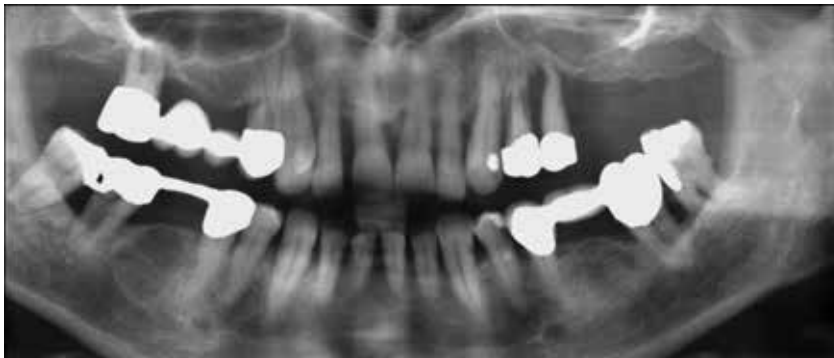
Abb. 2: Radiografisch sichtbare Zerstörung des alveolären Knochens bei chronischer Parodontitis

dagegen diabetesspezifisch, sie sind Folge der Hyperglykämie. Die neuropathischen Spätkomplikationen sind zum Teil diabetesspezifisch. Bei der peripheren sensomotorischen Polyneuropathie spielt der Alkoholgenuss eine bedeutende Rolle.