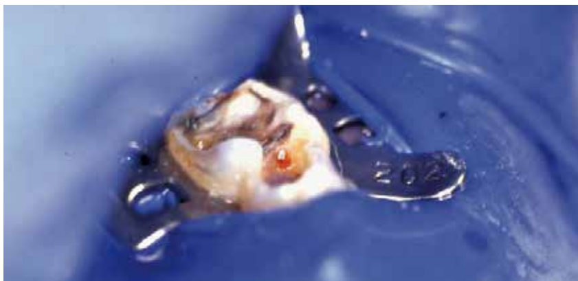
Abb. 2: Tiefe kariöse Läsionen am Milchzahn mit unklarer Schmerzanamnese werden besser mit einer Vitalamputation als mit cp-Maßnahmen therapiert.

in Hessen zeigten sogar eine der Kariesprävalenz von 33,6 bzw. 7,8 Prozent für ECC Typ I und II (Wetzel 2008). Der Behandlungsbedarf in dieser Patientengruppe ist in den letzten Jahren weiter gestiegen.