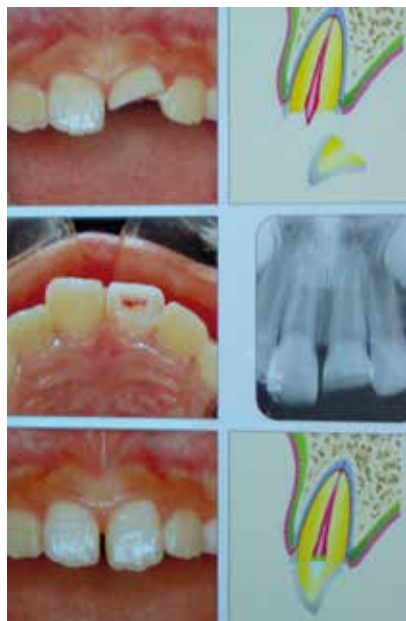
Abb. 1: Nach einem Trauma erfolgen eine partielle oder zervikale Pulpotomie mit Entfernung eines Pulpenhorns oder der gesamten Kronenpulpa, \text{Ca(OH)}_2 - bzw. MTA-Abdeckung und ein dichter Verschluss.

Endodontische Behandlungsmaßnahmen müssen gegenwärtig in der Regel in der Gruppe der Kinder mit meist durch die Nuckelflaschen verursachte Karies, die so genannte frühkindliche Karies (ECC), und bei den Kindern mit einem hohen Kariesrisiko im Kindergarten- und Vorschulalter vorgenommen werden. Die Anzahl der Kinder mit frühkindlicher Milchzahnkaries ist in den letzten Jahren trotz intensivierter Aufklärung weiter angestiegen. In Familien mit niedrigem Sozialstatus sehen wir bereits bei 27,3 Prozent der Klein- und Vorschulkinder die frühkindliche Karies (Baden & Schiffner 2008). Untersuchungen