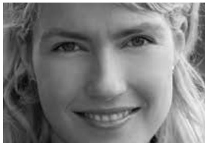
Sozialministerin Manuela Schwesig

Neben den Leistungsinhalten und dem Paragrafenteil der GOZ wurde ebenso die Frage der Vergütung angesprochen. Dabei wurde wieder-