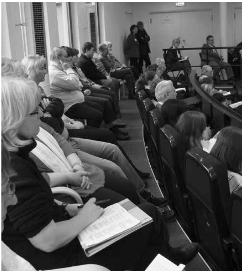
Teilnehmer verschiedener Berufsgruppen – allen voran Zahnärzte – informierten sich am 31. Januar in Rostock zum Thema „Häusliche Gewalt“.