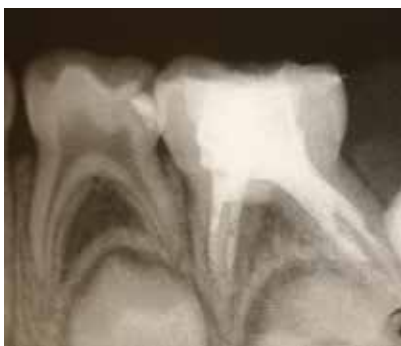
Abb. 4a und b: Kofferdam ist bei der Wurzelkanalbehandlung am Milchzahn unabdingbar (a), die Röntgenkontrollaufnahme ist dagegen nicht zwingend notwendig (b).

in den allermeisten Fällen mit einer deutlichen Schädigung der Pulpa einher, was eine cp-Behandlung als fraglich erscheinen lässt. Auch beim typischen Schmerzpatienten ist eine cp-Behandlung am Milchzahn nicht ausreichend.