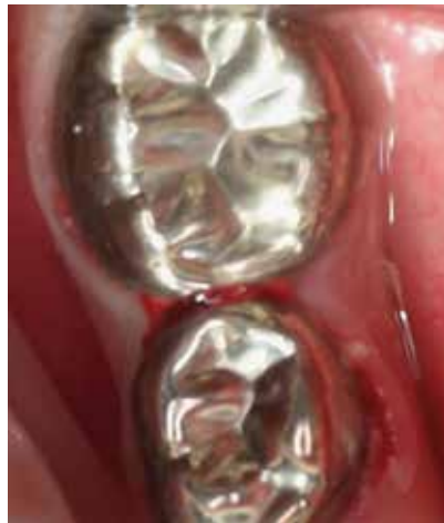
Abb. 3a und b: Bei der klassischen Vitalamputation wird die Kronenpulpa bis zu den Kanaleingängen entfernt. Ist die Blutstillung komplikationslos möglich (a), kann eine Abdeckung und die Versorgung mit einer Stahlkrone (b) erfolgen.