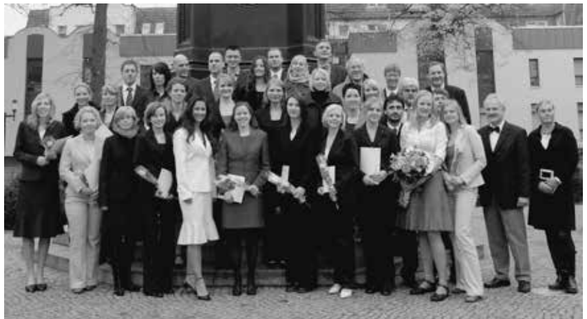
Die Absolventen 2008 des Zahnmedizinistudiums und des Masterstudiengangs „Zahnärztliche Funktionsanalyse“.